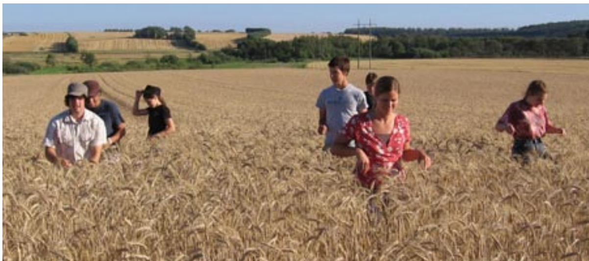
Teamet fra Montana havde også tid til lidt sightseeing, her i en dansk kornmark!

sammen i et band de kaldte "Push the Passerby". Teamet bestod af ni unge fra forskellige steder i USA, og målet for deres sommer var Danmark. Med et bredt udvalg af kendte sange fik de kontakt til mange forskellige mennesker, når de optrådte på gaden. Ind i mellem sangene delte de deres vidnesbyrd og gav en kort præsentation af evangeliet. Bagefter var der mange muligheder for videre samtaler med interesserede. De var unge, fra 16-21 år, men deres kærlighed til Kristus var mærkbar. De var i Svendborg, Grenå, Randers, Gråsten og Århus og tjente derudover med på Familielejren i Fjellerup. De var her i fire uger og efterlod en tom plads i mit hjerte, da de tog af sted.