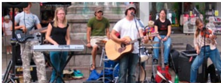
Bandet "Push the Passerby" rejste den lange vej fra Montana, USA for at spille med deres band og vidne for danskerne i sommervarmen.

Ungdom med Opgave, Montana, USA organiserer hvert år sommerfremstød for teenagere og unge. Denne sommer var der bl.a. et team, som spillede